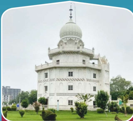
8 ਗੁ: ਮੰਜੀ ਸਾਹਿਬ (ਆਗਰਾ)