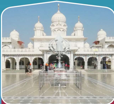
7 ਗੁ: ਦੂਖ ਨਿਵਾਰਨ ਸਾਹਿਬ ਗੁਰੂ ਕਾ ਤਾਲ (ਆਗਰਾ)