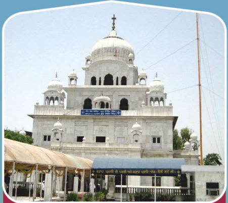
3 ਗੁ: ਸਾਹਿਬ ਮੋਤੀ ਬਾਗ ਪਾ: ੯ (ਪਟਿਆਲਾ)