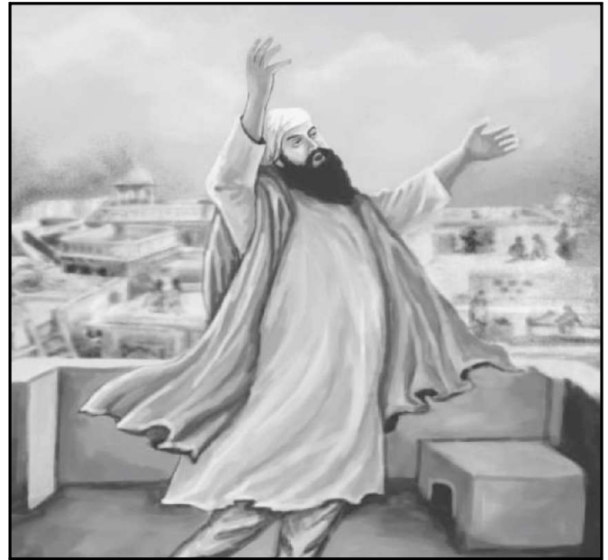
BABA MAKHAN SHAH LUBANA JI

The whole family followed Sikhism from the deep of its heart. Historians have written that his great grand father was also a disciple of Guru Nanak Dev Ji. The writers have written that Baba Makhan Shah Lubana was a staunch follower of Gurughar. He made a great contribution in Sikh history. The third great thing about him is that he revealed/discovered Sri Guru Teg Bahadar Ji. Actually it was he who first identified Sri Guru Teg Bahadur Ji and told the world about the real Guru.