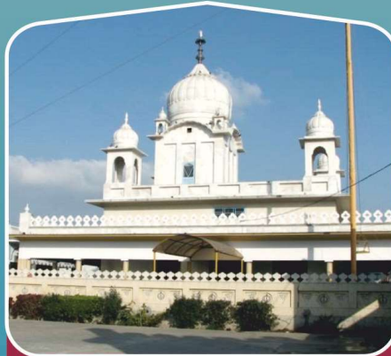
4 ਗੁ: ਗੜ੍ਹੀ ਸਾਹਿਬ (ਸਸਾਣਾ, ਪਟਿਆਲਾ)