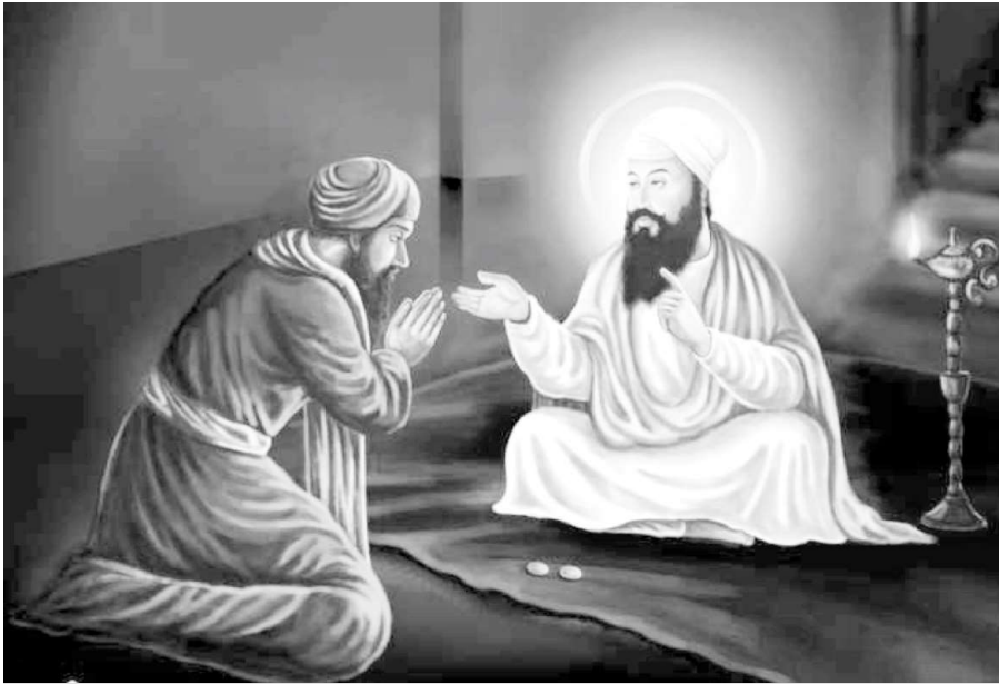
DHAN SRI GURU TEG BAHADAR SAHIB JI AND BABA MAKHAN SHAH LUBANA JI

virtuous. He was a lighthouse of Sikhism. He purchased goods and ladened the same on the ship. There were many types of goods in large quantity. He sold the goods in different countries. He bought more goods with the money so earned.