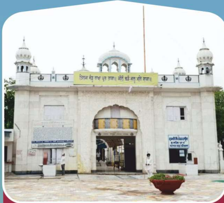
2 ਗੁ: ਸ੍ਰੀ ਗੁਰੂ ਤੇਗ ਬਹਾਦਰ ਜੀ ਬਹਾਦਰਗੜ੍ਹ (ਪਟਿਆਲਾ)