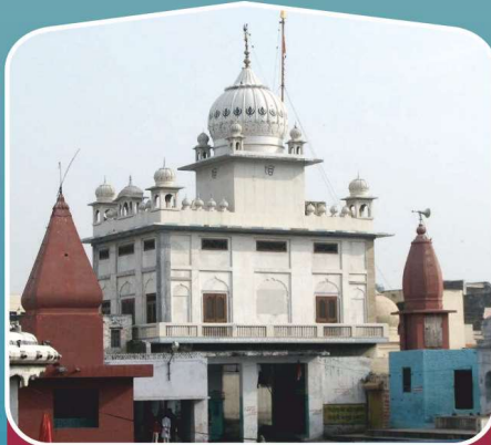
5 ਗੁ: ਸ਼ੀਸ਼ ਮਹਿਲ ਸਾਹਿਬ (ਪਿਰੋਵਾ, ਹਰਿਆਣਾ)