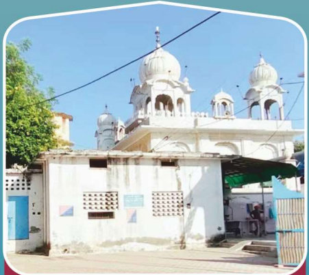
6 ਗੁ: ਬੰਗਲਾ ਸਾਹਿਬ (ਰੋਹਤਕ, ਹਰਿਆਣਾ)