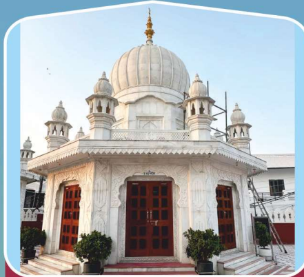
1 ਗੁ: ਬੜ੍ਹਾ ਸਾਹਿਬ (ਸ੍ਰੀ ਅਨੰਦਪੁਰ ਸਾਹਿਬ)